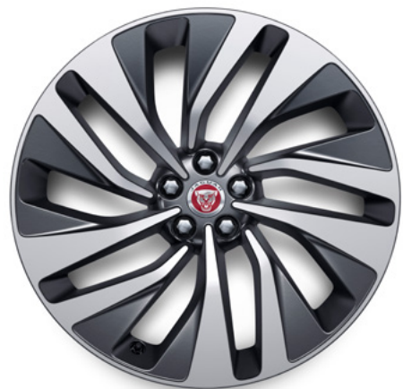
21" スタイル1068, 10スポーク, サテンドークグレイ コントラストダイヤモンドターンドフィニッシュ

現代的でダイナミックなデザインのアロイホイールのバリエーションで、あなたのクルマにさらなる個性を。