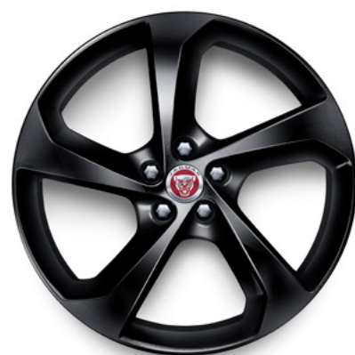
19" スタイル5037, 5スポーク, グロスブラック