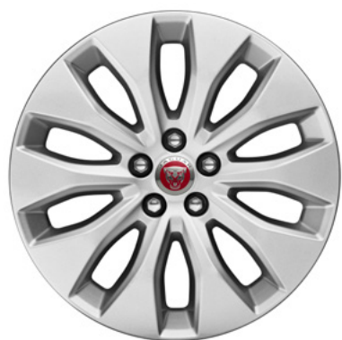
18" スタイル1021, 10スポーク, グロスパークルシルバー

現代的でダイナミックなデザインのアロイホイールのバリエーションで、あなたのクルマにさらなる個性を。