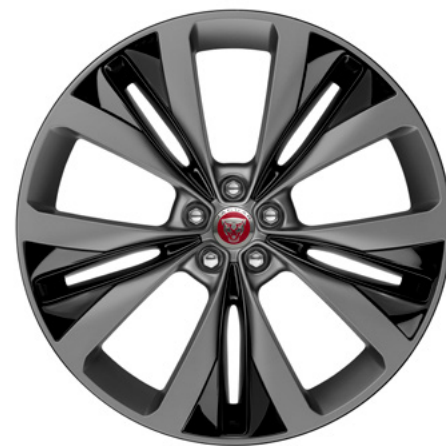
22" スタイル1020, 15スポーク, グロスグレイ コントラストインサート