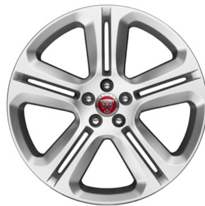
20" スタイル5036, 5スプリットスポーク, グロスパークルシルバー