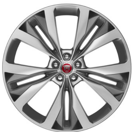
22" スタイル1020, 15スポーク, グロスシルバー コントラストインサート