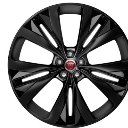
22" スタイル1020, 15スポーク, グロスブラック サテンプラックインサート