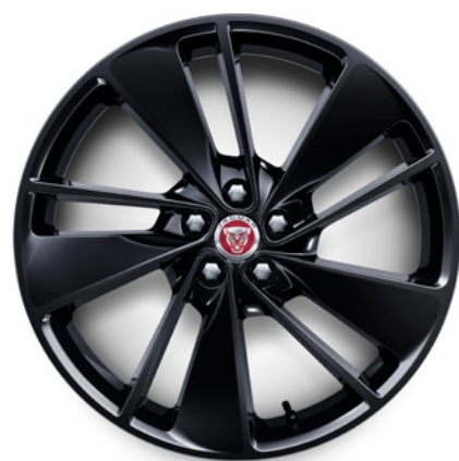
20" スタイル1067, 10スポーク, グロスブラック