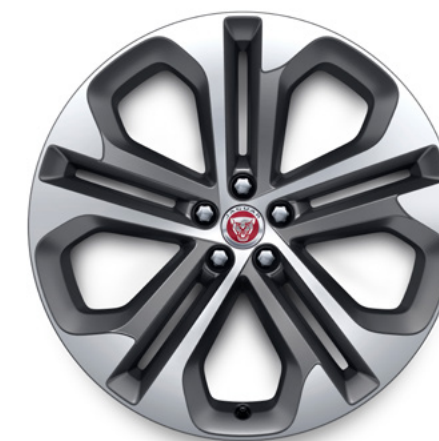
21" スタイル5104, 5スプリットスポーク, サテンダークグレイ コントラストダイヤモンドターンドフィニッシュ