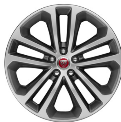
19" スタイル5038, 5スプリットスポーク, グロスグレイ コントラストダイヤモンドターンドフィニッシュ