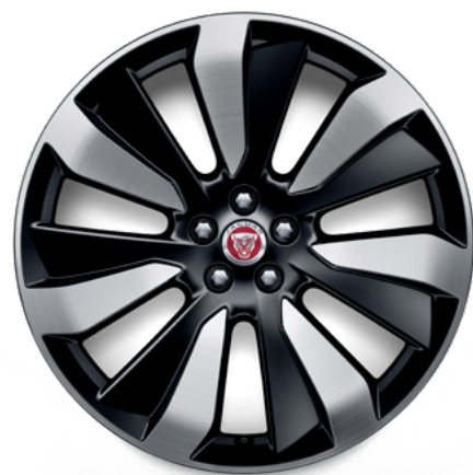
21" スタイル7024, 7スポーク, グロスブラック ダイヤモンドターンドフィニッシュ