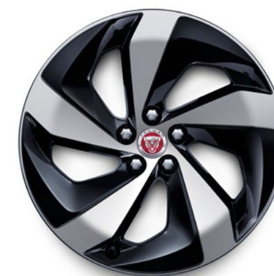
19" スタイル5103, 5スポーク, グロスブラック コントラストダイヤモンドターンドフィニッシュ