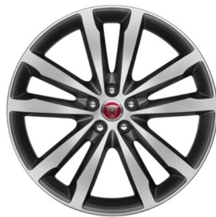
20" スタイル5031, 5スプリットスポーク, グロスグレイ コントラストダイヤモンドターンドフィニッシュ